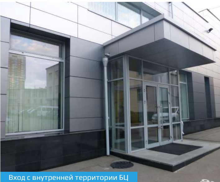
Вход с внутренней территории БЦ