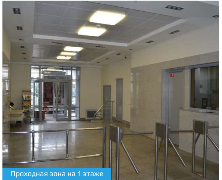
Проходная зона на 1 этаже