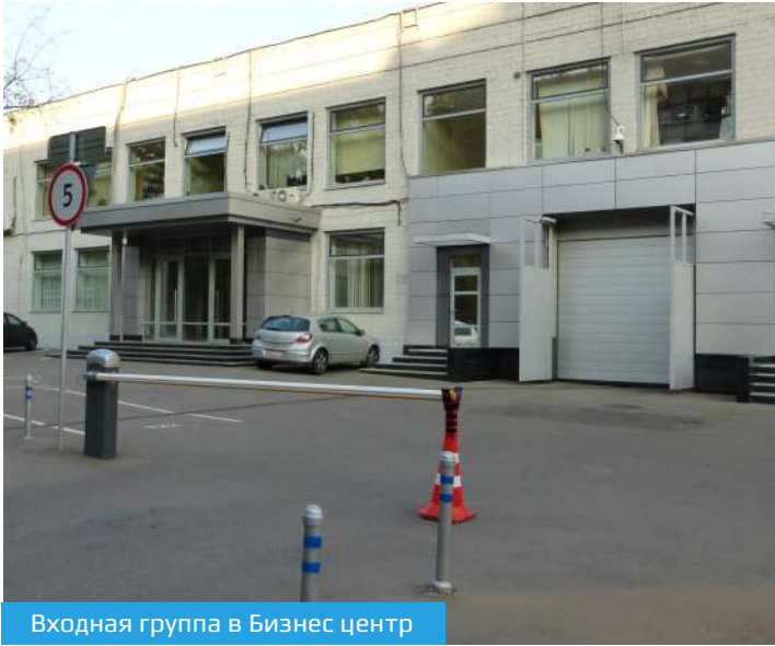
Входная группа в Бизнес центр